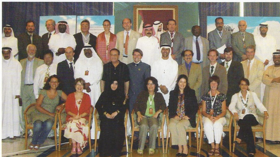
Firma de adhesión a la candidatura multinacional ante la UNESCO. Abu Dhabi, agosto 2009.

La primera ya se está produciendo, y no es otra que la visibilidad de la cetrería. Nuestra práctica pasa desapercibida a la sociedad. No olvidemos que consiste en cazar con un ave de presa, por lo que habitualmente se manifiesta con un Hombre sólo en el campo. Sin embargo, habitualmente la imagen que se ha tenido procede de las exhibiciones de vuelo en mercados medievales o de competiciones.