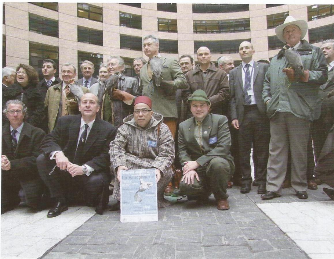
Estrasburgo, 17 de enero de 2011. El Parlamento Europeo recibe a representantes cetreros de toda Europa para celebrar el reconocimiento de la UNESCO a la cetrería.

http://www.unesco.org/culture/ich/index.php?lg=es&pg=00011&RL=00442 (2011)