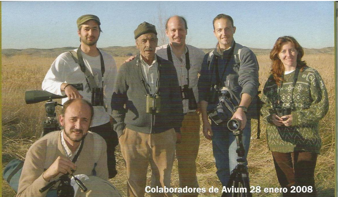
Colaboradores de Avium 28 enero 2008