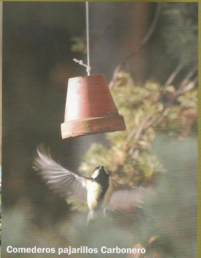
Comederos pajarillos Carbonero

particulares de tal forma que los clientes puedan acercarse con nosotros a observar las aves en su medio natural sin tener que "hacer cola" o estar rodeados de furgonetas y público como ocurre en lugares más populares. Ofrecemos, si el cliente lo desea, estancias exclusivas en lugares de ensueño. Estamos abiertos y capacitados para ofrecer al cliente lo que quiera en el ámbito ornitológico. Desde ir a ver a la Alondra ricotí Chersophilus duponti , conocer de primera mano el anillamiento científico o ir a cazar un zorro con un águila real. También ofrecemos viajes a los ya clásicos destinos de Doñana, Monfragüe, paso migratorio del Estrecho, Humedales de La Mancha, Hoces del río Duratón... ampliando hasta cubrir las principales Zonas de especial protección para las aves ZEPA catalogadas en España.